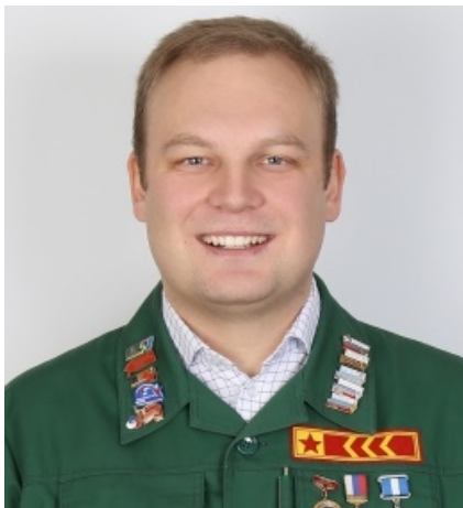
ЮРИЙ БОЛДЫРЕВ, министр молодёжи Челябинской области